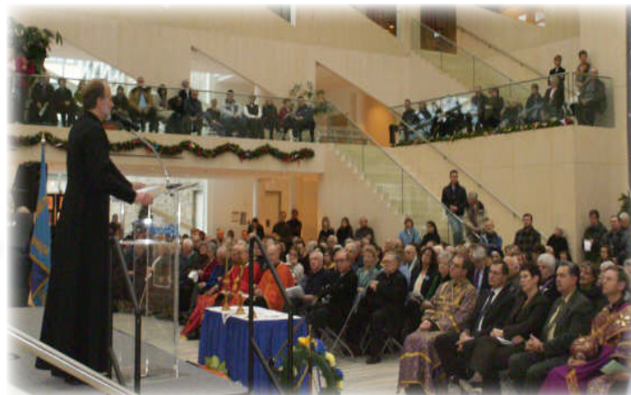
Holodomor Commemoration in Edmonton