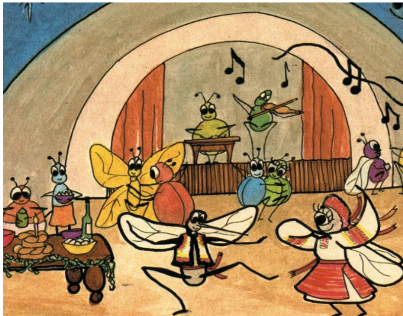
Having Fun with Language